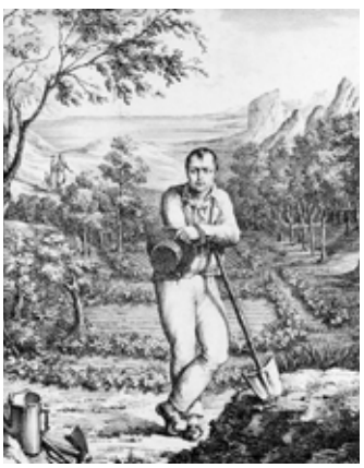
2: Napoleon I. mit Spaten