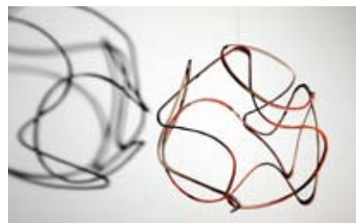
5: Werner Mally, Umlaufbahnen, 2009