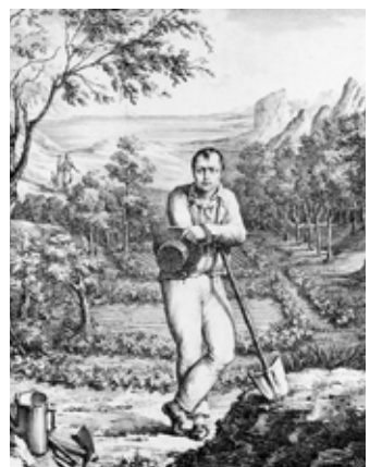
2: Napoleon I. mit Spaten