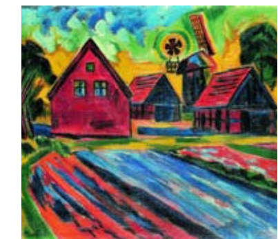
11: Max Pechstein, Ohne Titel, Holzschnitt auf Leinwand, 19xx, Copyright: