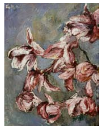
12: Hans Jürgen Kallmann, Große Magnolie, Öl auf Leinwand, 1974 und 1981

Durch die häufig themenbezogene Auswahl der Werke Kallmanns in den Ausstellungen der letzten Jahre sind manche der Schlüsselwerke des Künstlers nicht mehr gezeigt worden. Diese Highlights aus den Museumsbeständen sind nun im Winter wieder zu besichtigen; dazu kommen Neuerwerbungen und Schenkungen. Kallmanns kraftvolle, expressive Werke haben heute ebenso viel Gültigkeit wie in der Zeit ihres Entstehens im 20. Jahrhundert. Beginnend mit den stimmungsgeladenen, oft etwas düsteren Landschaften des Frühwerks über die farbintensiven Bilder der 50er und 60er Jahre bis zu den einfühlsamen, oft psychologisch entlarvenden Porträts seiner reifen Schaffensjahre fasziniert die Kunst Kallmanns immer wieder aufs Neue.