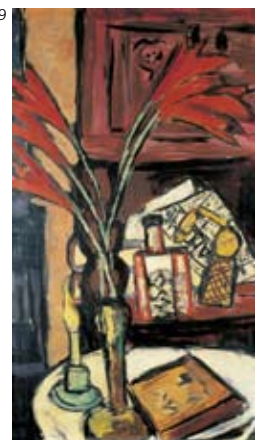
8: Peter Lang, Abendstimmung, Öl auf Leinwand, 2011, Copyright: P. Lang