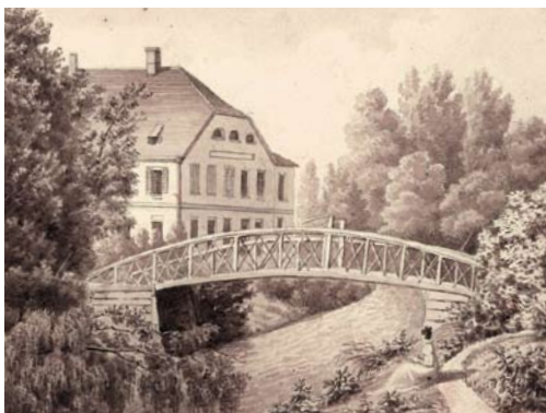
Schloss Ismaning, Hortense de Beauharnais, Sepiazeichnung 1817