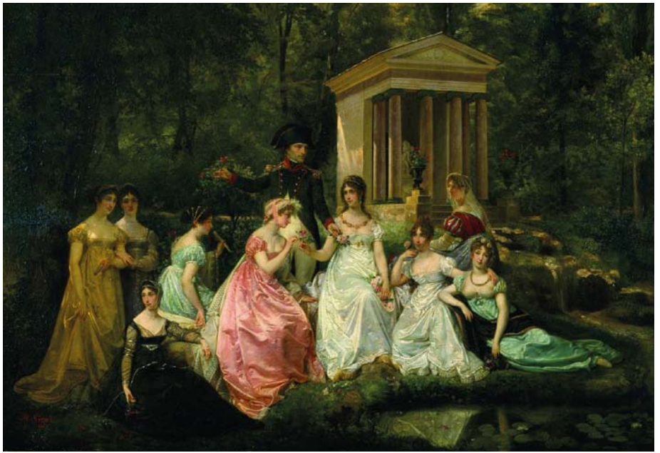
La Rose de Malmaison , Jean-Louis-Victor Viger, 1855

Kallmann-Museum und Schlossmuseum Ismaning