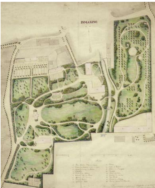
Plan des Schlossparks , Zeichnung, 1837