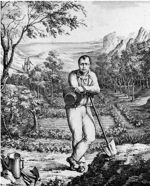
Der Gärtner von St. Helena , Napoleon I mit Spaten, Lithografie, 1814

Weitere Veränderungen folgten nach 1836. Unter der Regie des Hofbaumeisters Jean Baptiste Métivier entstanden eine neue Zierbrücke, eine Laubenanlage mit Springbrunnen und die große Orangerie für den Nutzgarten. Heute befindet sich an gleicher Stelle das Kallmann-Museum. 1852 endete die Zeit der Leuchtenbergs in Ismaning. 1919 kaufte die Gemeinde Ismaning das Schloss mit seinen Park- und Gartenanlagen. In den 50er Jahren wird der Park für die Allgemeinheit geöffnet.