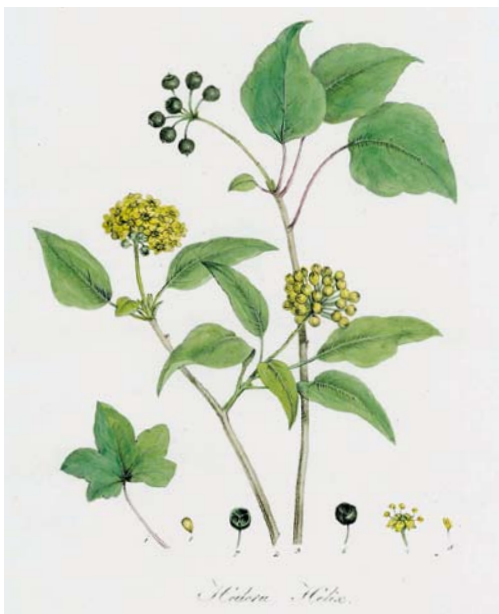
Flora Monacensis, Hedera Helix , Lithografie, 1811